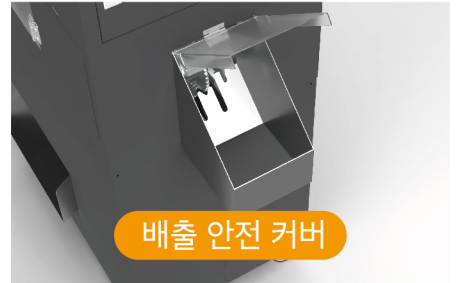
배출 안전 커버