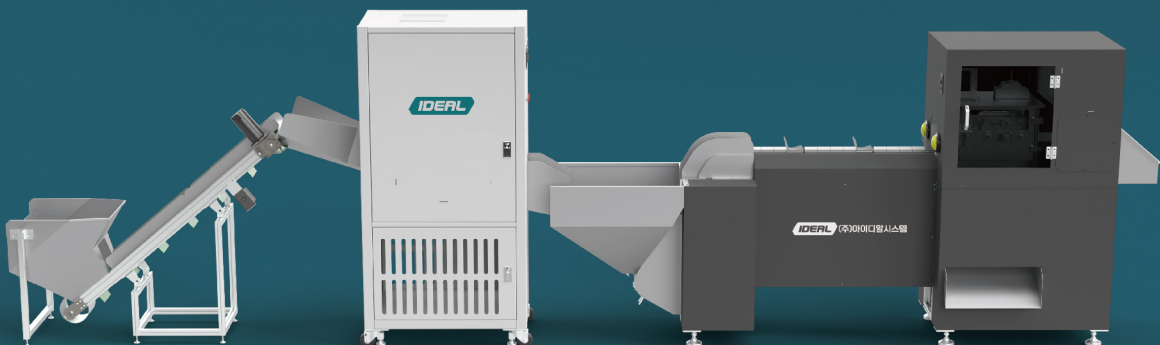
투입호퍼 및 상승컨베이어