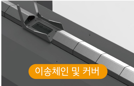
이송체인 및 커버