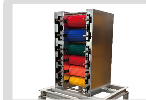
3차 쪽 분리