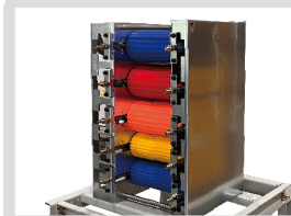
2차 쪽 분리